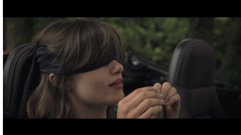
TEASER - A LA FOLIE, PAS DU TOUT

2012 - LES BOUTONS DORÉS - COURT MÉTRAGE 18', RED 4K, 2.0